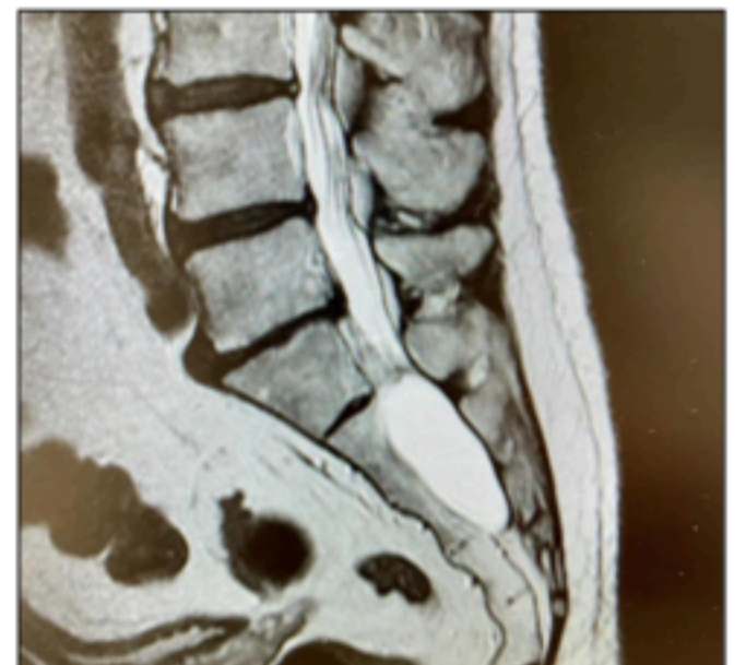
Imágenes de dispositivo de RFP lumbosacro Voyager (Alfamed) en un caso de acceso retrógrado por quiste masivo de Tarlov en paciente refractario a RFP transforaminal.