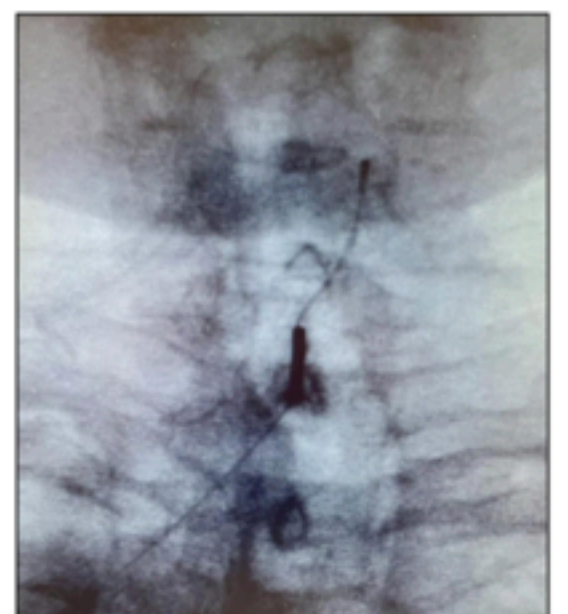
Imágenes de dispositivo de RFP cervical Voyager Linear (Alfamed) aplicado a dos pacientes: uno sobre GRD C8 izdo y otro en GRD C6 derecho.